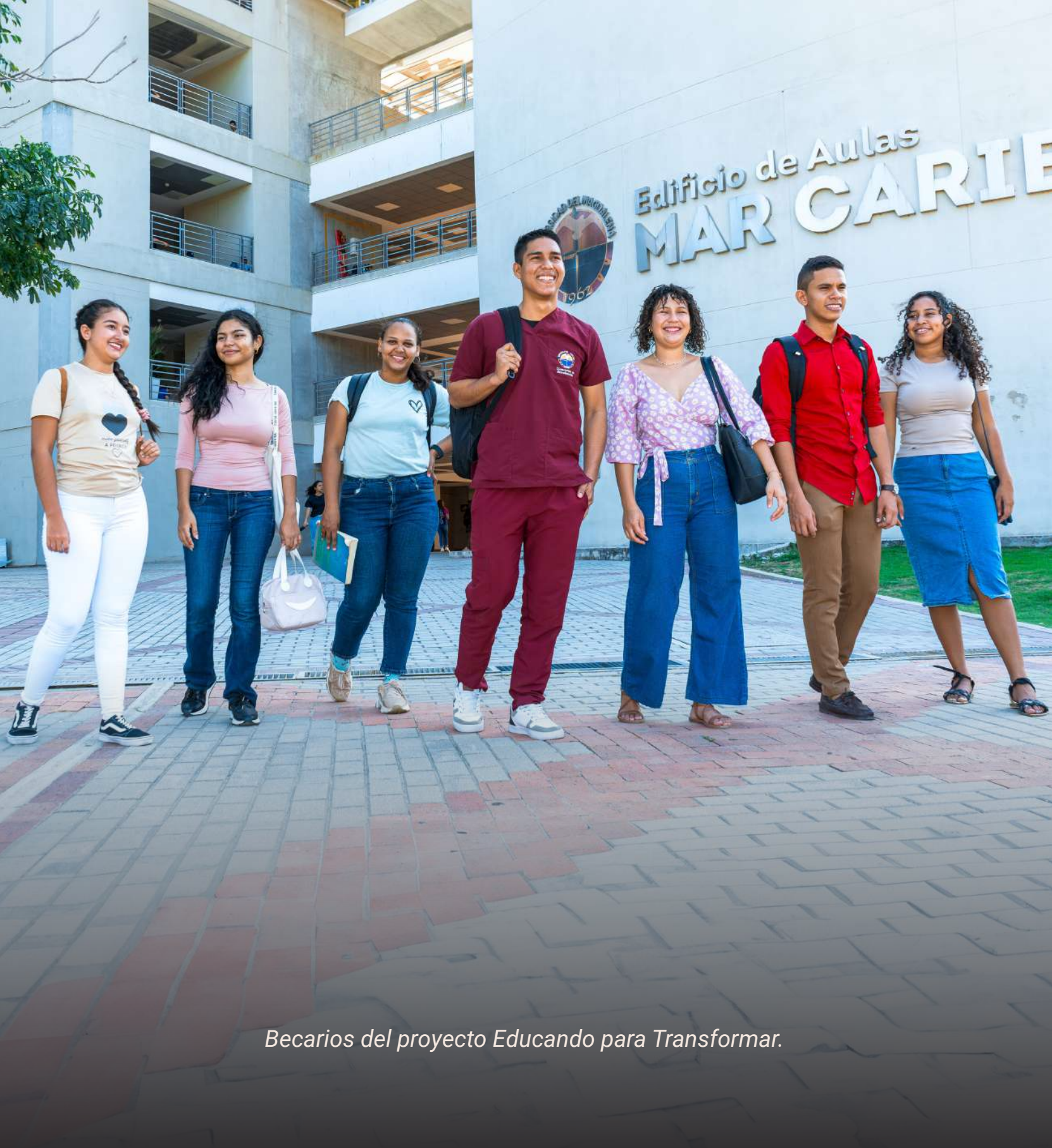
Becarios del proyecto Educando para Transformar.