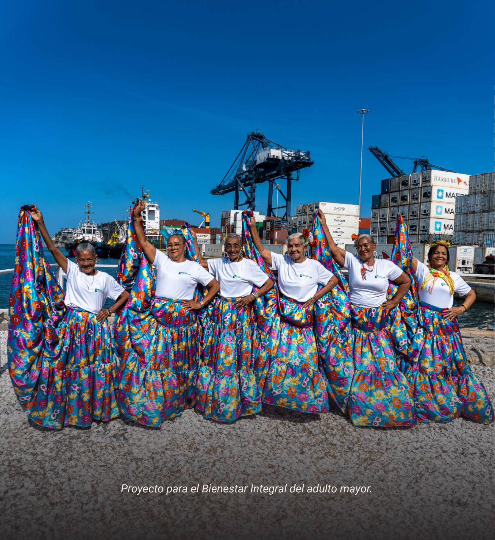
Proyecto para el Bienestar Integral del adulto mayor.