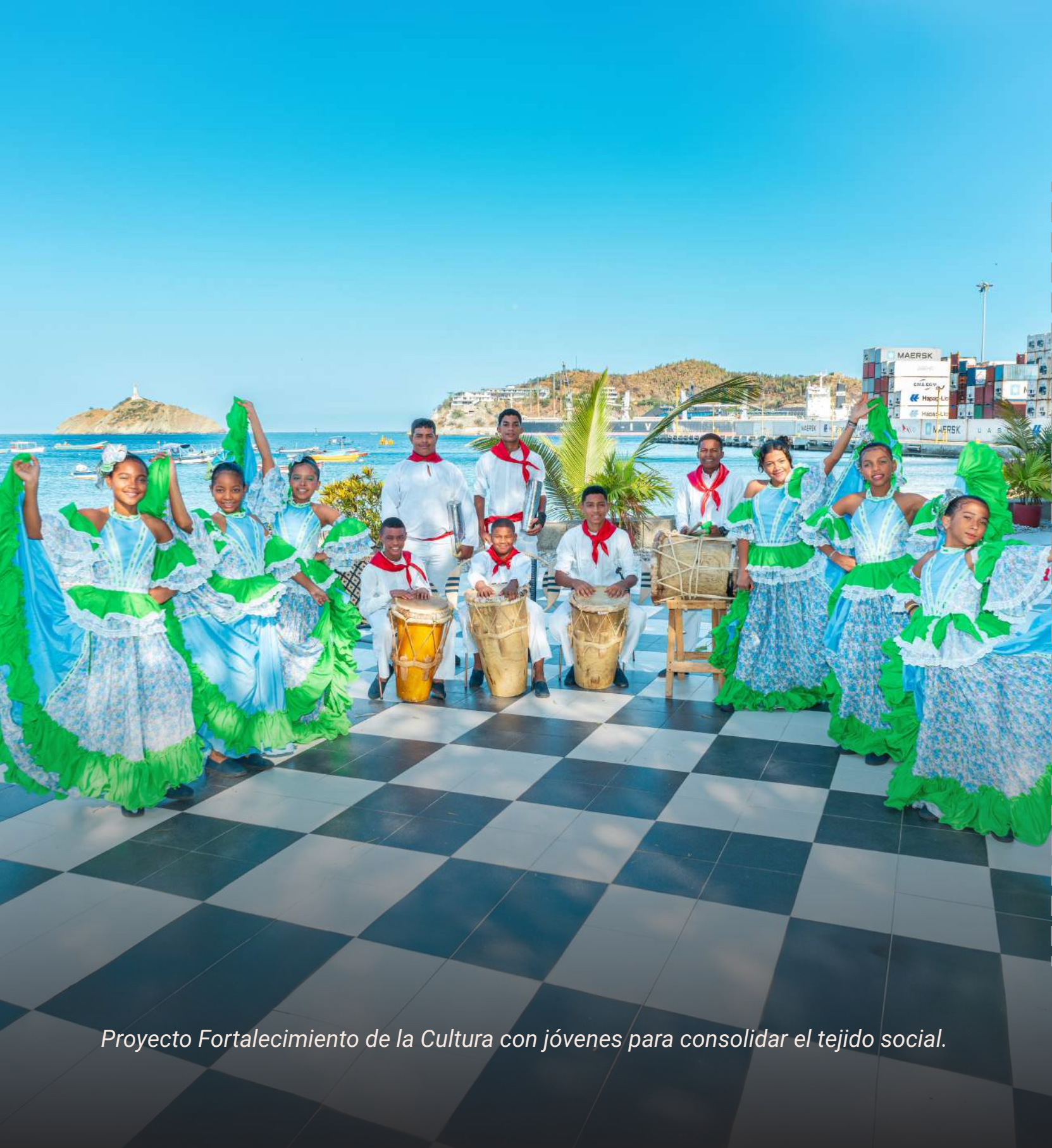
Proyecto Fortalecimiento de la Cultura con jóvenes para consolidar el tejido social.