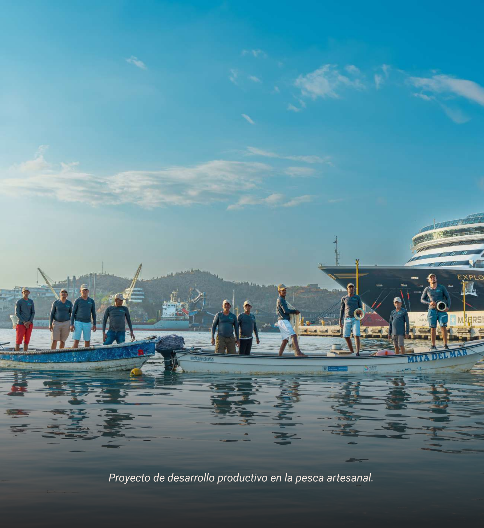
Proyecto de desarrollo productivo en la pesca artesanal.